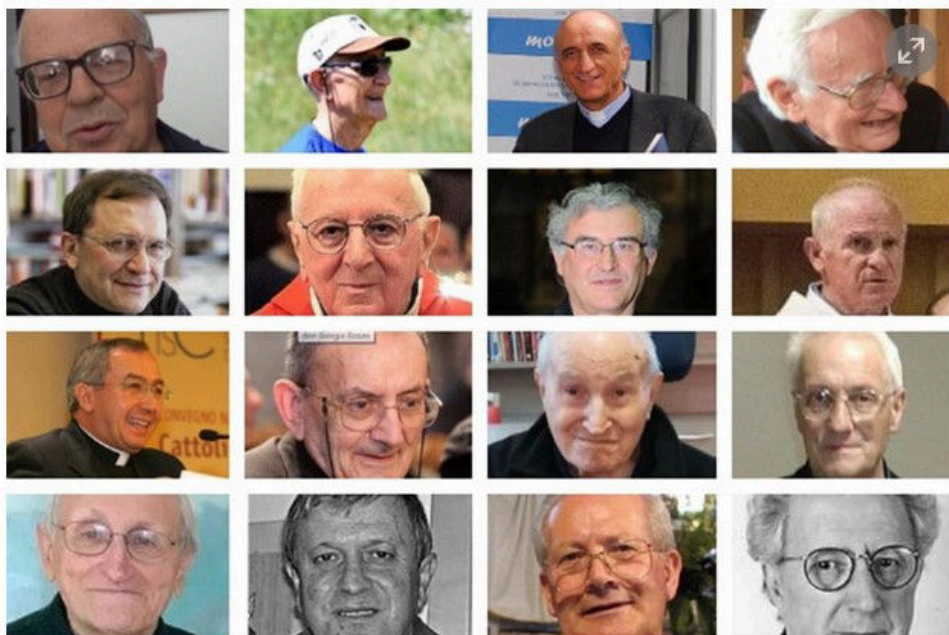
Alcuni volti dei sacerdoti deceduti durante la pandemia

Oltre 200 fra medici ed infermieri ad oggi (fine maggio) deceduti a causa del coronavirus. Persone che sono decedute a causa dei contatti avuti nella maggior parte dei casi in strutture ospedaliere. A questi angeli della carità si aggiungono i 121 sacerdoti deceduti in Italia in questi tre mesi di pandemia. Non si tratta di soli sa-